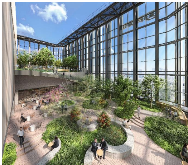
(27・28階 屋上テラス・ラウンジ)